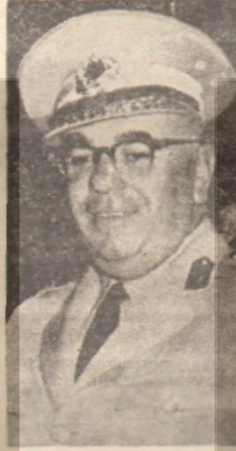
Korgeneral Refet Ülgenalp Derdi biliyor

Türk milliyetçileri, milletvekili bile seçilen bu Atatürk düşmanı, bölücü sahte milliyetçileri iyi tammahdır.