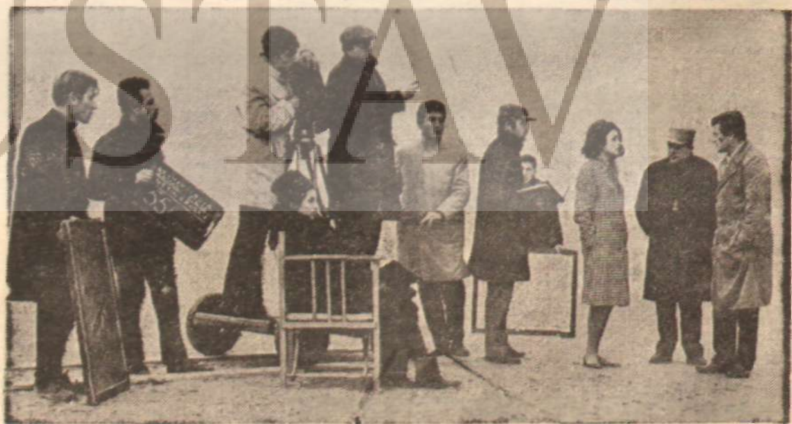
«Sevmek Zamanı'nın çekiminden bir görünüş.

Yeni çıktı 5 Lira GERÇEK YAYINEVİ Çağaloğlu Yokusu - İst.