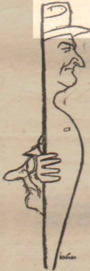
JOHNSON'UN İKİ YÜZÜ CENTO ve Amerikan müdahalesi Johnson Amerikan, milletleri zorla korumaya kararlıdır. Çıkar

İşte benim anladığım Türk genç ve Türk gençliği.