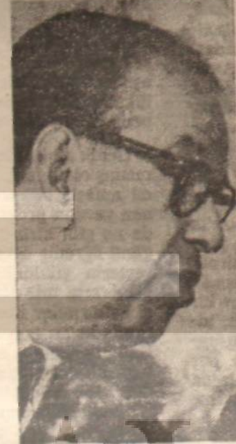
Feridun Cemal Erkin Amerikanın tutumunu açıkladı