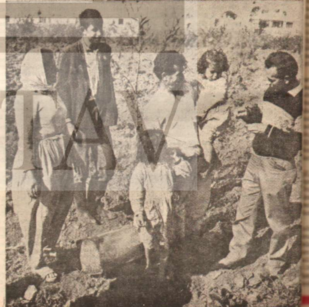
Bir Barış gönüllüsü, Türk çiftçileri arasında.